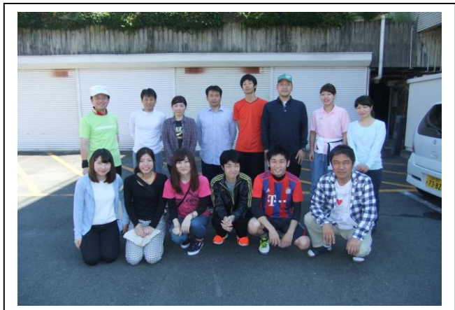
(今回の参加メンバー)