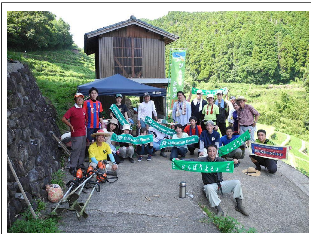
（終了後、参加者全員との記念撮影）