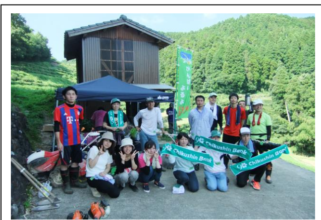
(職員のための記念撮影)