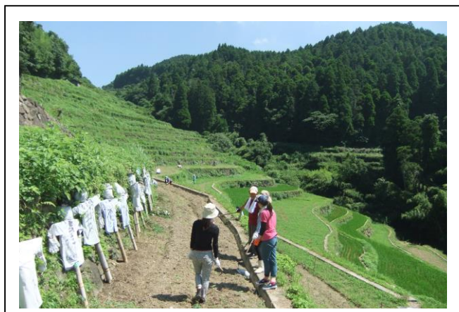
(案山子といっしょ)